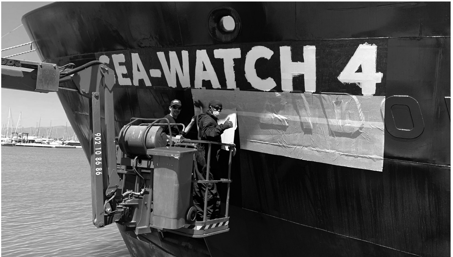
Die ehemalige Poseidon erhält ihren neuen Namen (Foto: Philipp Guggenmoos).