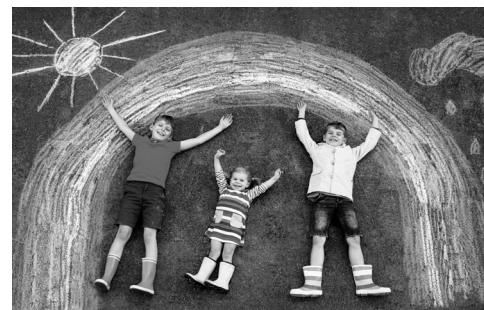
„Alles Gute kommt von oben“ – wer so vertraut, kann fröhlich und zuversichtlich durch's Leben gehen.

Jesus hat das Verhältnis von Segen und Fluch neu bestimmt. In Matthäus 5,44 fordert er: „Segnet, die euch verfluchen!“ Am Kreuz hat er den Fluch des Gesetzes auf sich genommen (Galater 3,13), damit der Abrahamssegen über die Grenzen des Volkes Israel hinaus wirksam wird.