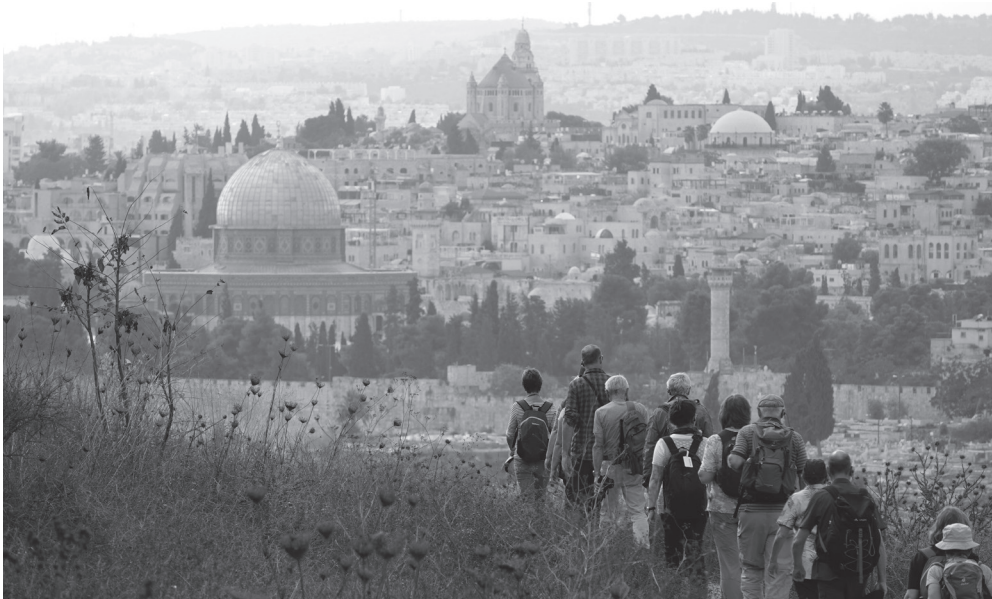
Eine Reisegruppe zieht wie die Pilger nach Jerusalem ein, mit Blick auf Felsendom und Dormitio-Abtei.

Die neuntägige Reise startet mit Tel Aviv, der modernen Hightech- und Partymetropole des Landes. Weiter geht es für drei Nächte in den Norden des Landes in einen Kibbuz nahe dem See Genezareth. Von dort aus erkunden wir die heiligen christlichen Stätten am See, das Mystikerstädtchen Safed und die Golanhöhen. Eine Nacht verbringen wir am Toten Meer, wobei ein Bad im Meer und der Besuch der Herodesfestung Massada auf dem Programm stehen. Höhepunkt der Reise ist der Besuch der Heiligen Stadt Jerusalem, wo wir noch weitere drei Tage übernachten. Außer den Highlights wie dem Ölberg, der Via Dolorosa mit Grabeskirche, der Klagemauer und dem Tempelberg, besuchen wir die Holocaustgedenkstätte Yad Vashem und schließlich Bethlehem im palästinensischen Autonomiegebiet. Dort empfängt uns eine deutschsprechende christliche Familie in ihrem Haus zum Mittagessen und erzählt von ihrem Leben hinter der Sperrmauer.