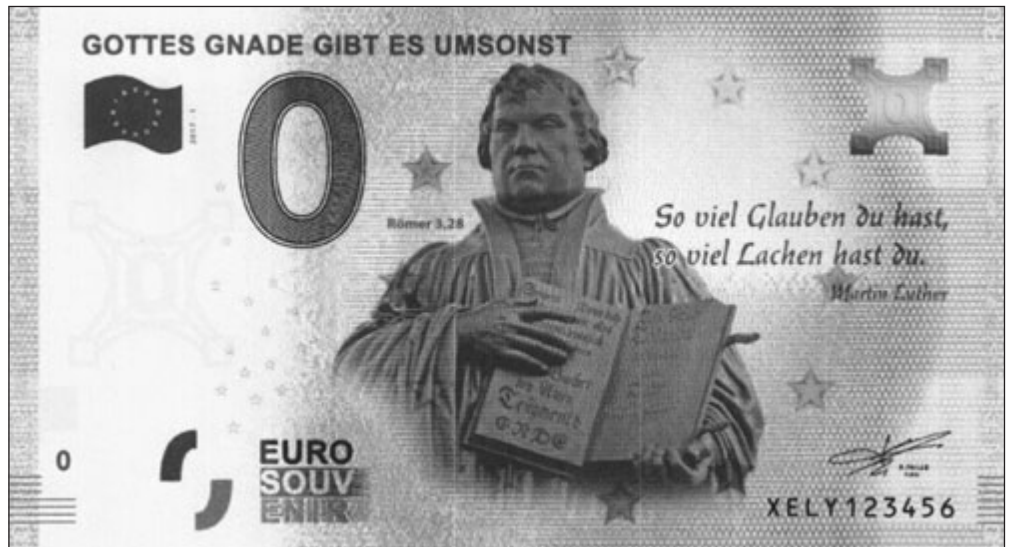
„Gottes Gnade gibt es umsonst“ – als Erinnerung daran kann man anlässlich des 500-jährigen Reformationsjubiläums unter www.gott.net einen echten 0-Euro-Schein bestellen – er hat zwar keinen Geldwert, ist aber doch ein Wertpapier, denn diese Zusage von Gottes Gnade gilt zu jeder Zeit und überall auf der Welt.

Und auch Martin Luther versuchte alles, um so zu leben, wie es Gott gefällt. Aber je mehr er sich bemühte und anstrengte,