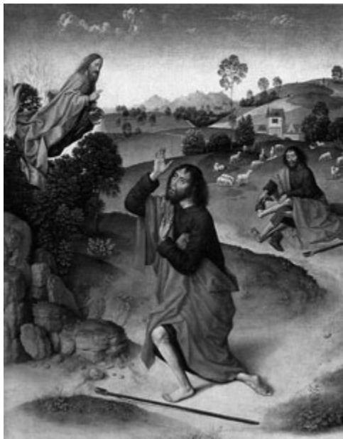
Dierick Bouts, Moses (um 1460).

20. bis 29. Oktober 2017, Gemeindehaus Markuskirche, Bussardweg 1, Kempten Täglich 8.00 bis 18.00 Uhr (samstags geschlossen), Eintritt frei