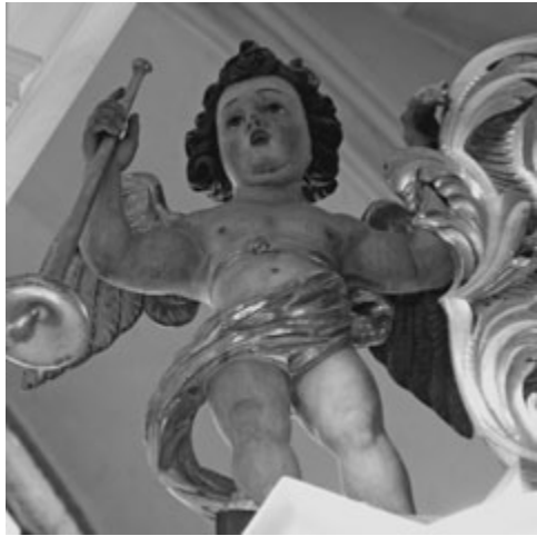
Orgelengel in der St.-Mang-Kirche