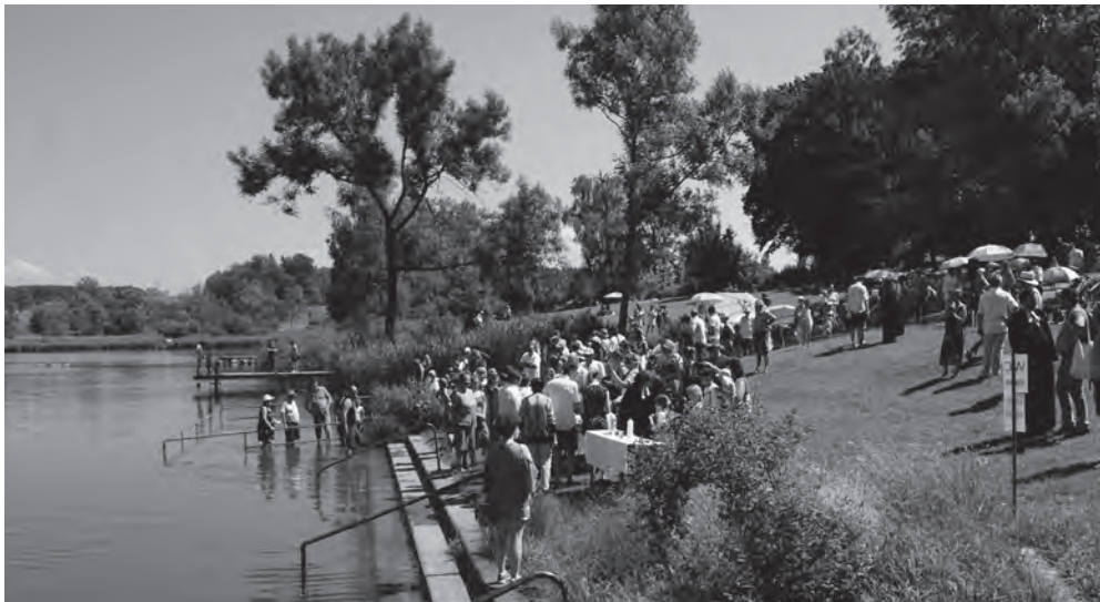
Auf der Liegewiese am Bachtelweiher fand am 30. Juni 2019 das erste Kemptener Tauftfest statt, bei dem 31 Kinder, Jugendliche und Erwachsene getauft wurden. Ein beeindruckendes Erlebnis!