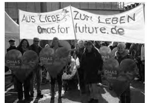
Omas for future sind auch im Allgäu aktiv, hier bei einer Demonstration im Januar. Infos: www.omasforfuture.de