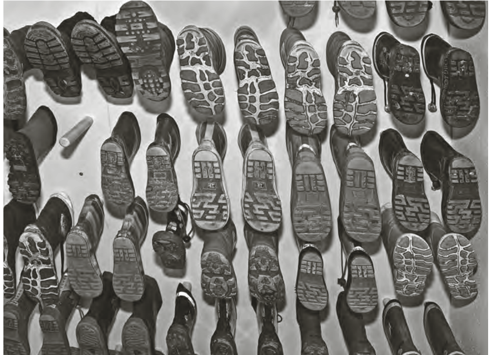
Gummistiefel-Parade an der Wand einer Kita: Viele Kindergärten platzten aus allen Nähten. Der Platzmangel soll mit Containern und Raum-Modulen aufgefangen werden.

Neben neuen Einrichtungen sind auch Übergangslösungen mit ergänzenden Raum-Modulen in bestehenden Kindergärten nötig. In dem katholischen Kindergarten der Pfarrei St. Franziskus sollen solche Module entstehen.