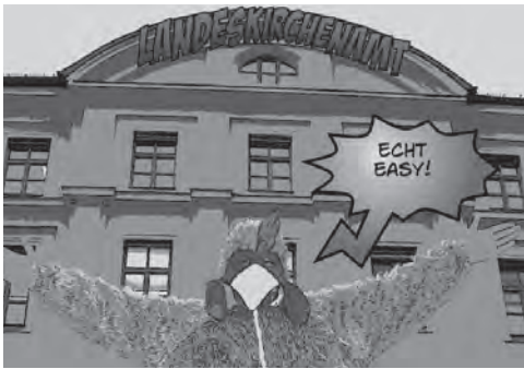
Grüner Gockel im Anflug

Der Grüne Gockel ist ein Umweltmanagementsystem nach der europäischen EMAS-Verordnung (EMAS = eco management and audit scheme), angepasst an kirchliche Bedürfnisse. Es ist deutschlandweit bereits in über 1000 Kirchengemeinden erprobt. Das oberste Ziel heißt: Sich in der Bewahrung der Schöpfung (= dem Umweltschutz) kontinuierlich weiter zu verbessern.