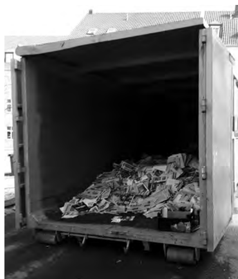
Oft war der Container gut gefüllt – und das Sparschwein wurde immer runder.