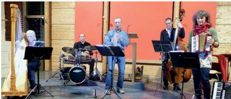
Klezmer Gruppe „Mazel g'het“ - Auferstehungskirche, 2017

Eintritt für das Konzert ist frei - Spenden erbeten